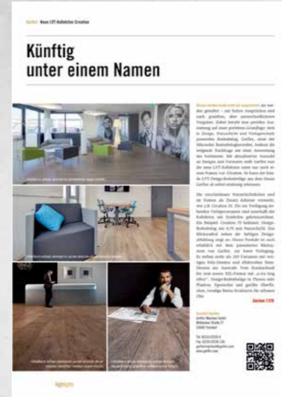
Einzelseite Hochformat 4 Abbildungen 1.370 Zeichen Fließtext (inkl. Leerzeichen)